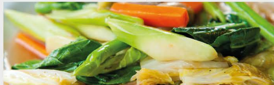
Alle prijzen zijn inclusief B.T.W.

Alle hoofdgerechten zijn inclusief witte rijst. Met Bami of Nasi € 0,50 extra. Met Mihoen of Chinese Bami € 2,50 extra. 🌶️ = Licht pikant 🌶️🌶️ = Medium pikant